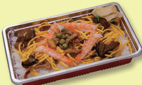
ちらし寿司 660 円 (600円税抜価格)