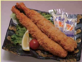
ジャンボ海老フライ