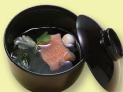
吸物 242 円 (220円税抜価格)