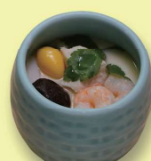
茶碗蒸し 495 円 (450円税抜価格)