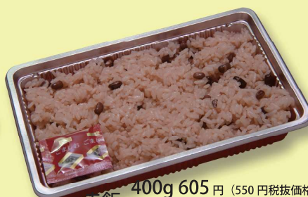
赤飯 400g 605 円 (550円税抜価格) 280g 385 円 (350円税抜価格)