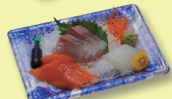
刺身パック 880 円 (800円税抜価格)