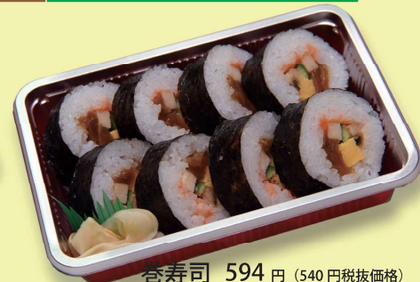
巻寿司 594 円 (540円税抜価格)