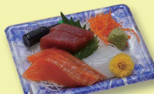
刺身パック 660 円 (600円税抜価格)