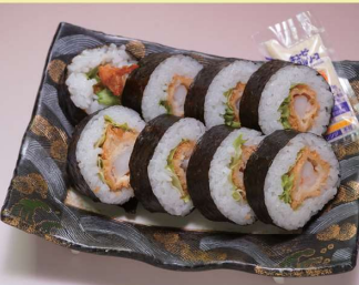
ジャンボ海老フライ巻