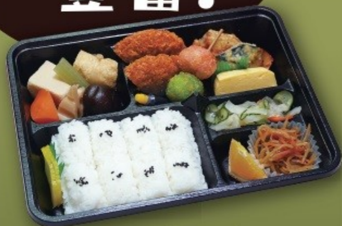
幕ノ内弁当[なごみ] [26.5cm×20.5cm] 1,100円(1,000円税抜価格)

このチラシ掲載商品は一部です。総合カタログをご希望の方は、お電話またはハガキにてご請求くださいませ。早急にお送りさせていただきます。料理内容等お気軽にご相談ください。ご注文、ご相談は下記電話まで。