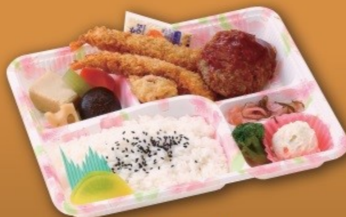
ミックス弁当 [27cm×22cm] 1,430円(1,300円税抜価格)