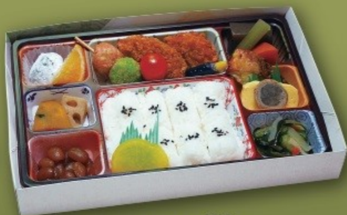
幕ノ内弁当[若竹] [28cm×18cm] 1,320円(1,200円税抜価格)