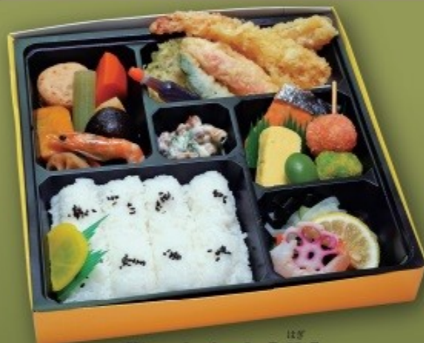
幕ノ内弁当[萩] [32cm×29cm] 1,980円(1,800円税抜価格)