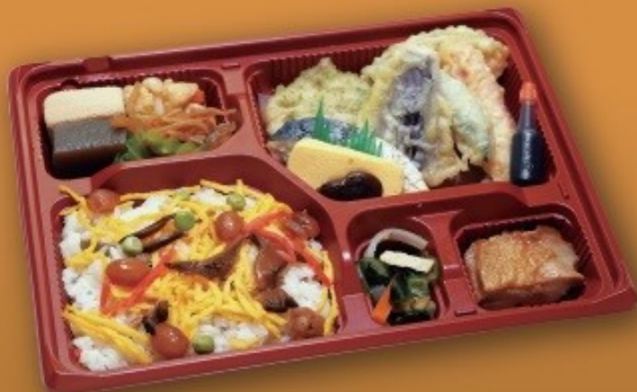
寿司弁当[山吹] [7cm×21cm] 1,100円(1,000円税抜価格)