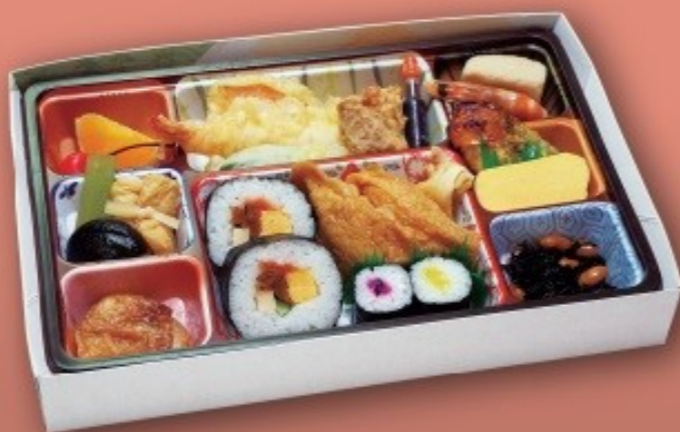
味ごよみ [28cm×18cm] 1,320円(1,200円税抜価格)

※お届けはお買上げ総額10,000円(税込)以上とさせていただきます。(島しょ部は除く)