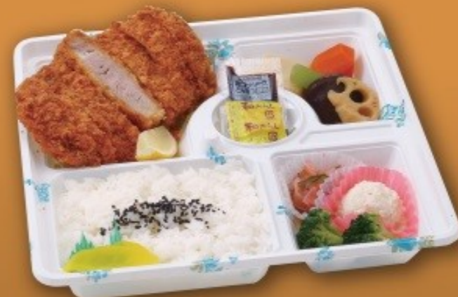
とんかつ弁当 [27cm×27cm] 1,650円(1,500円税抜価格)