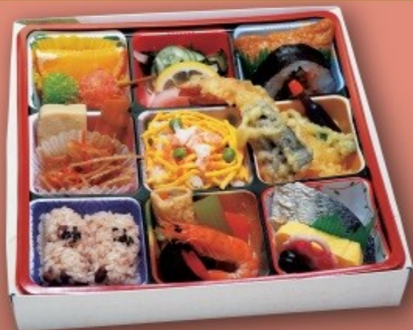
食彩弁当 [24cm×24cm] 1,980円(1,800円税抜価格)