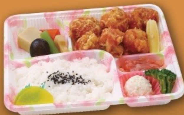
唐揚げ弁当 [27cm×22cm] 1,430円(1,300円税抜価格)